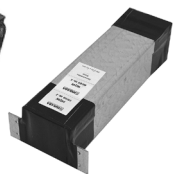
Schall-Isobox Standard Schall-Isobox DUO*